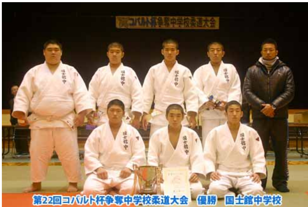
第22回コバルト杯争奪中学校柔道大会 優勝 国土館中学校